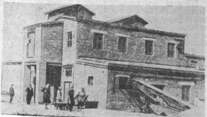
Стройки нашего города требуют большое количество железобетонных изделий. Прежде из-за недостатка их сильно задерживались работы на строительных площадках. Не так давно введен в эксплуатацию новый цех сборного железобетона. Он снабжает строителей более совершенным оборудованием.