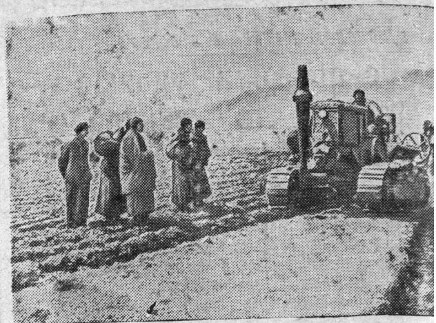
Правительство Китайской Народной Республики оказало помощь тибетскому народу. В центр Тибета — Лхасу тракторы, производящие трудоемкие работы на полях. На снимке: трактор венгерского производства на Лхасу.

Справки на продажу мяса владельцам животных будут выдаваться только при предъявлении ими квитанции о забое скота на пункте или через подворного забойщика скота.