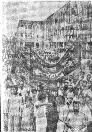
Республика Индия. 15 августа пять тысяч участников движения мирного сопротивления предприняли мирный поход в Гоа, Даман и Диу, чтобы потребовать прекращения иностранного правления.

Португальская полиция и войска открыли по ним огонь в различных пунктах границы между Индией и Гоа. Сообщения о расстреле участников мирного похода вызвали волну возмущения в широких кругах индийской общественности. В различных городах страны состоялись митинги и демонстрации в знак протеста против этой зверской расправы.