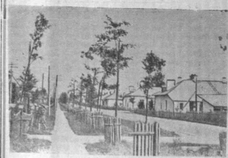
На снимке: улица 1 Мая в поселке Большие Лучки.