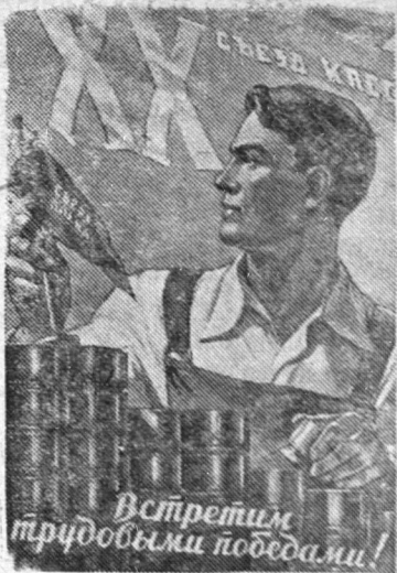
Плакат работы художника В. Корецкого (Государственное издательство изобразительного искусства).