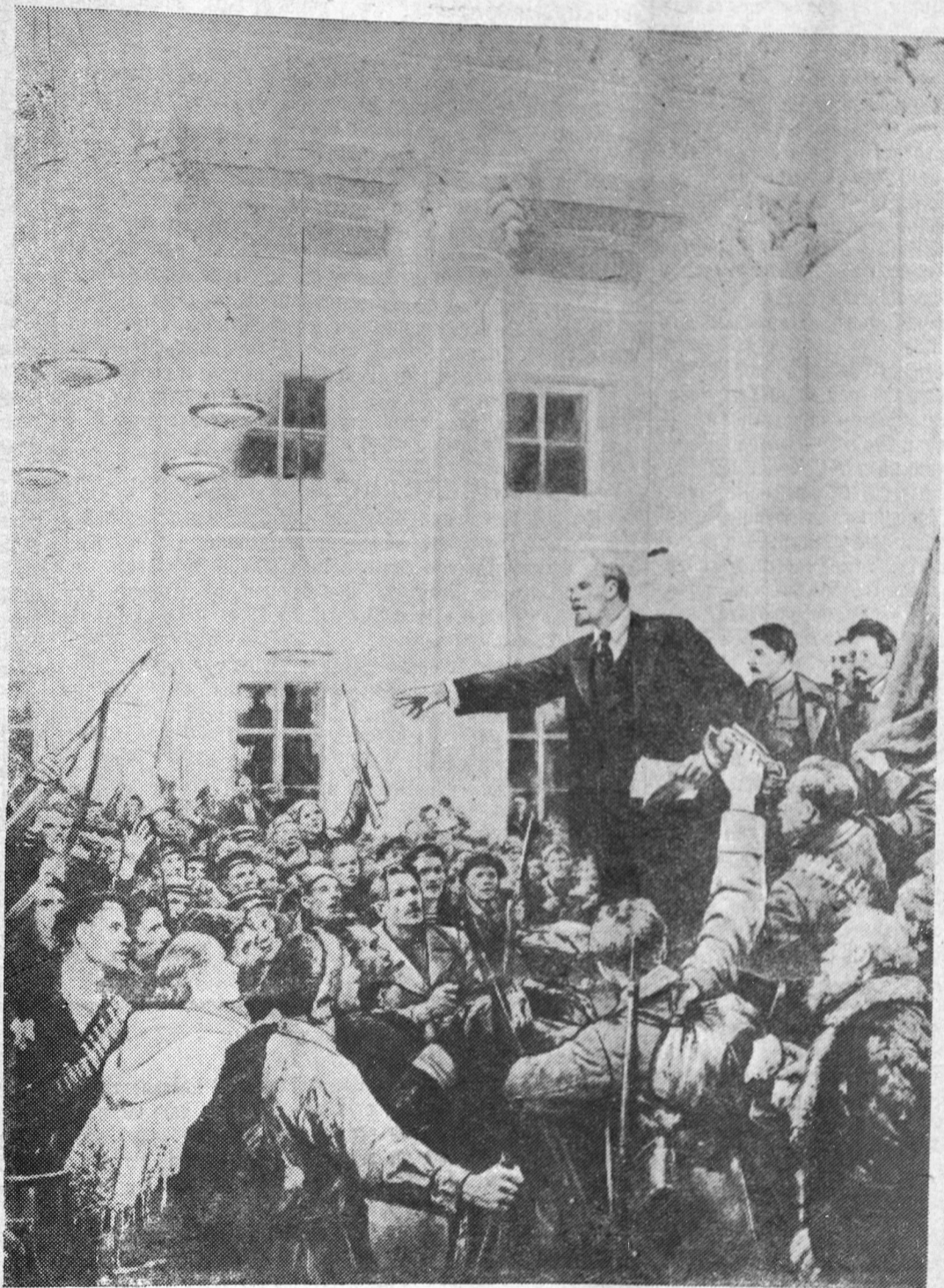
С картины художника В. А. Серова: «В. И. Ленин провозглашает советскую власть».

и смерти идеи Великого Октября живут и побеждают. Вперед идут трудящиеся страны демократии. Могучий коммунистический лагерь, возглавляемый Советским Союзом объединяет в своих рядах миллионы человек. Этот лагерь наглядно демонстрирует силу и жизнеспособность идей Октября — идей коммунизма, демократии и социализма. Советский народ полон решимости и впереди своим созидательным трудом неустанно укреплять могущество социалистического государства.