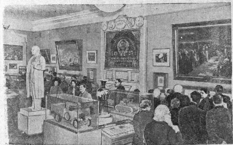
Москва. В Государственном музее революции СССР шесть новых залов. В них размещены материалы, собранные в период иностранной интервенции и гражданской войны (1918—1920 гг.). Экспозиция четвертого и шестого залов характеризована словами «Оружием мы га, трудом мы добудем за работу, товарищи!» выставленные в этих залах посвящены периоду борьбы на путь восстановления и развития (1921—1929 гг.). На снимке: посетители из новых залов музея. * * *

В заключение доклада докладчик выразил уверенность, что районная партийная организация имеет организовать активную работу рабочих, колхозников, инженерно-технических работников, специалистов хозяйства и служащих в жизни и труде, поставленных правительством перед партией и народом задач промышленности и сельского хозяйства.