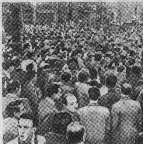
В Париже недавно состоялась демонстрация служащих, требующих повышения жалованья.