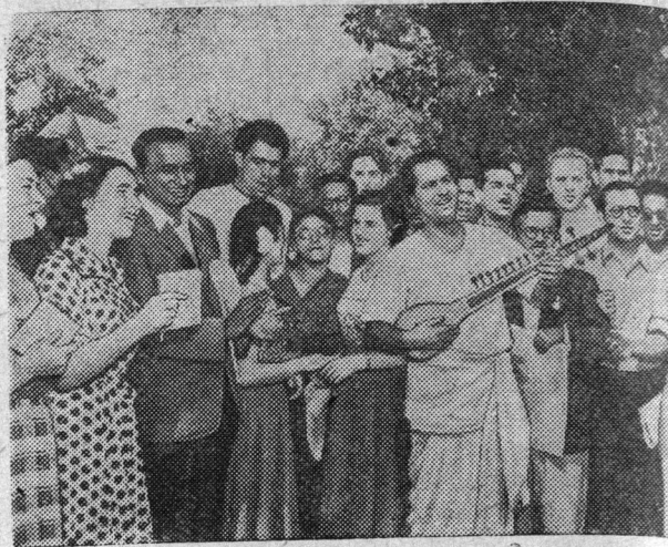
Варшава. На пятом Всемирном фестивале молодежи студентов за мир и дружбу.

Встреча советской и индийской делегаций. В советской делегации пришло более 150 индийских студентов, рабочих, артистов, журналистов.