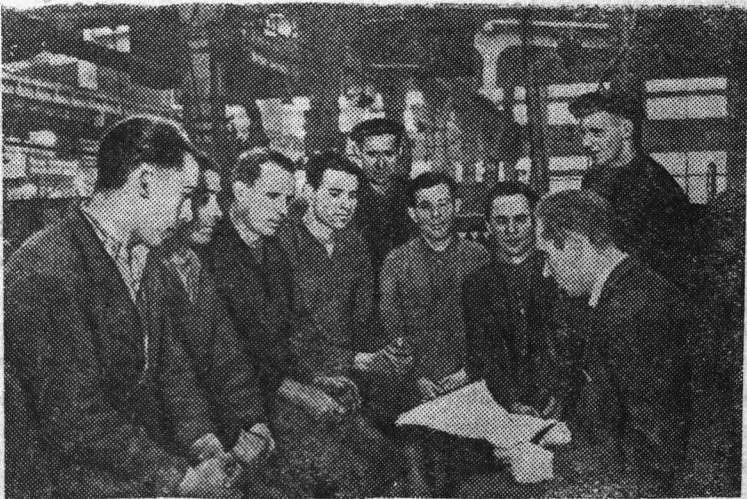
Москва. Трудящиеся столицы с огромным интересом знакомятся с проектом Директив XX съезда КПСС по шестому пятилетнему плану развития народного хозяйства СССР.

Применение радиоактивных изотопов послужит широкому развитию технического прогресса в сланцеводобывающей промышленности.