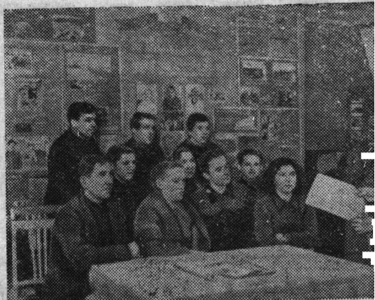
С большим воодушевлением встретили Ленинградской области проект Директив XX по шестому пятилетнему плану развития партия СССР на 1956—1960 годы. На снимке: председатель сельхозартела им. М. И. Васильева, из гатом XX съезда КПСС от Ленинградской области, знакомит колхозников с проектом Директив.