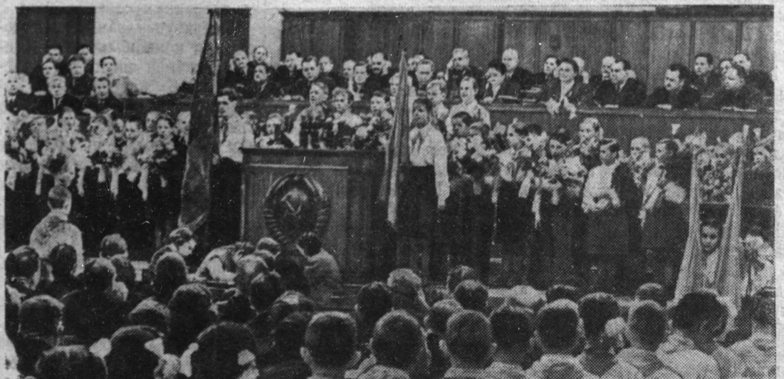
Москва. Большой Кремлевский дворец. На снимке: пионеры столицы приветствуют делегатов XX съезда Коммунистической партии Советского Союза.

Коллектив комбината подсобных предприятий, единодушно одобряя решения XX съезда партии, неуклонно повышает выработку. В эти дни особенно хорошо трудятся бригады бетонщиков т. Чикуровой, столяров т. Бутько, бригады рабочих цеха лесопиления т. Богданова и др. Все они выполняют по полторы нормы и более.