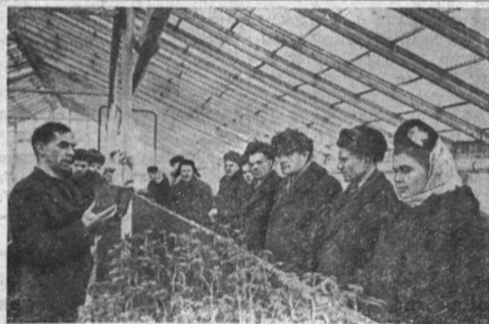
На снимке: группа передовиков сельского хозяйства Ленинградской области в теплице колхоза «Красный партизан», Всеволожского района, знакомятся с новыми способами выращивания рассады помидоров.

топливом. За два дня ими подготовлено 140 рамомест и засеяно ранней капустой и другими овощными культурами более 25 рамомест.