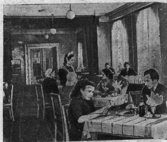
Облпотребсоюз и отдел торговли Облсполкома столовых и чайных в районах Ленинградской области открыла новую столовую на 100 мест в Красном Селе. На снимке: в зале новой столовой.