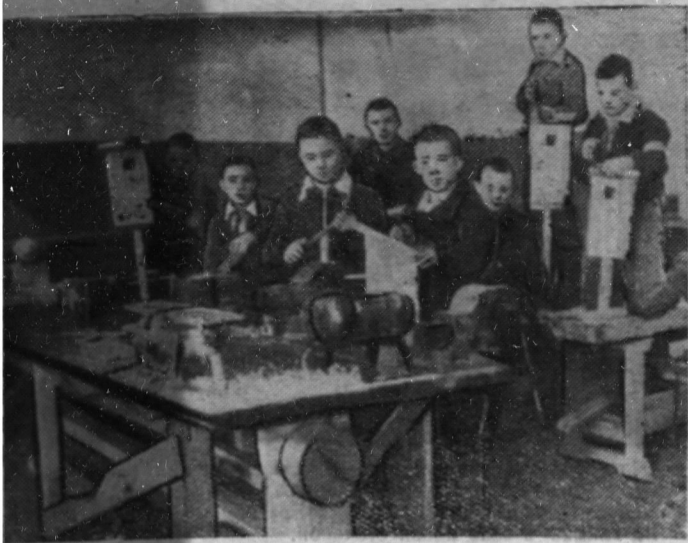
Интересно и увлекательно проходят уроки труда в Сланцевской шестилетней школе № 5. На снимке: учащиеся изготавливают скворечники в столярной мастерской.