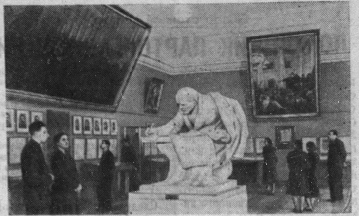
Москва, 22 апреля исполняется 86 лет со дня рождения основателя Коммунистической партии Советского Союза и Советского государства В. И. Ленина.

Районная детская библиотека оформила интересную фотовыставку, на которой представлены фотоснимки и картины из жизни великого Ленина. Кроме этого, библиотека ежедневно проводит для юных читателей беседы и громкие чтения рассказов о Владимире Ильиче.