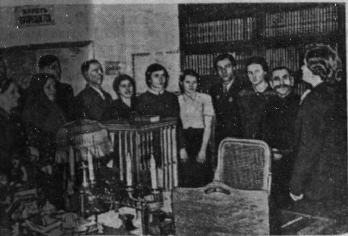
Москва. В эти дни многочисленные группы экскурсантов посетили рабочий кабинет и квартиру В. И. Ленина в Кремле. На снимке: колхозники сельскохозяйственной артели «Путь Ильича» (село Кашино), Волоколамского района, Московской области, в кабинете В. И. Ленина.