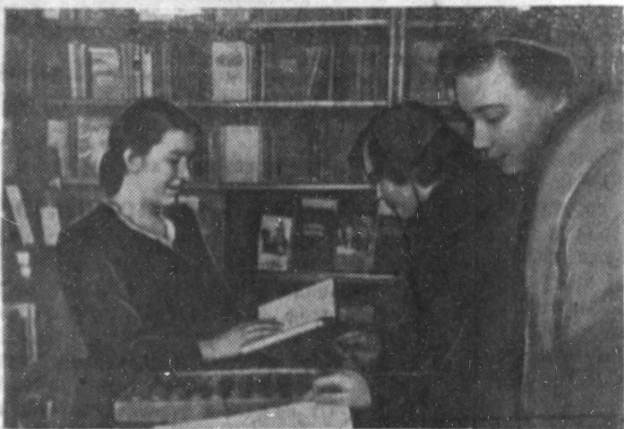
Магазин Ленинготорга поселка Большие Лучки из месяца в месяц перевыполняет план. Здесь долго не задерживаются новинки литературы.

Особенно оживленно было в магазине в предпраздничные дни. Ведь книга — лучший подарок.