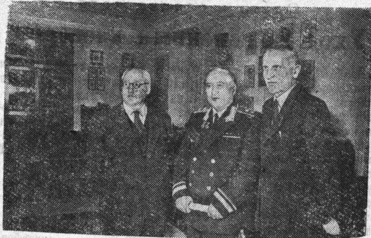
В Москве, на улице Радио, открылся научно-мемориальный музей великого русского ученого профессора Николая Егоровича Жуковского — создателя русской авиационной науки, воспитавшего выдающихся деятелей отечественной авиации. Тщательно и любовно подобранные экспонаты иллюстрируют жизненный и творческий путь «отца русской авиации», его научное наследие, его талантливых учеников. Огромный интерес представляет зал, посвященный истории русской авиации. Открытие музея приурочено к 109-й годовщине со дня рождения Н. Е. Жуковского.