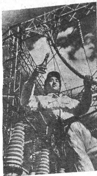
В Корейской Народно-Демократической Республике быстрыми темпами восстанавливается электроэнергетическое хозяйство. С вводом в эксплуатацию восстановленных и построенных мощностей значительно увеличится производство электроэнергии.

АДРЕС РЕДАКЦИИ: г. Сланцы, ул. Кирова, дом № 8.