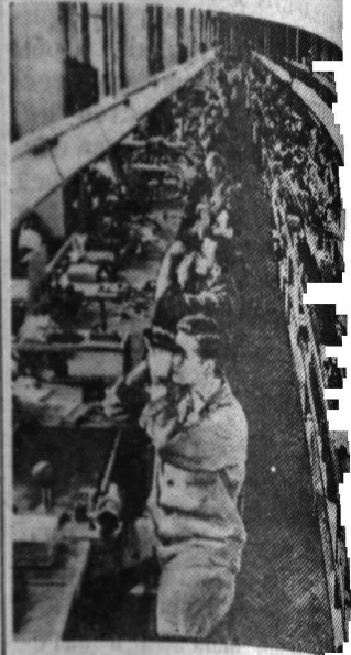
Германская Демократическая Республика. Объем производства химических заводов в Йене, принадлежавших ранее фирме «Кай Цейсс», в настоящее время шесть раз превышает довоенный уровень. Кроме фотоаппаратов, очков, микроскопов, заводы готовят астрономическую аппаратуру и оборудование для петард.

Против передачи законопроекта на рассмотрение коммисий голосовала фракция СДПГ.