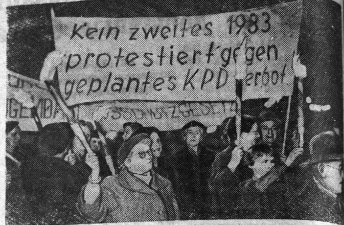
Федеральная Республика Германия. Факельное шествие протеста жителей Бремена против введения воинской повинности и запрещения КПГ.