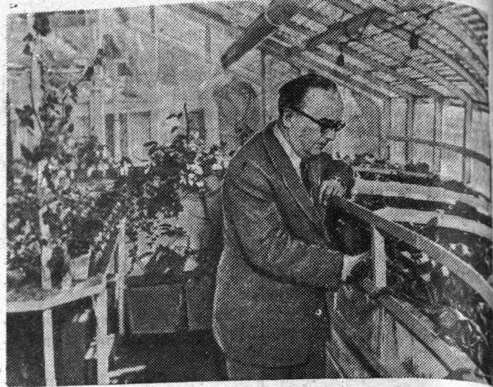
Венгерская Народная Республика. Шопронхорпачский научно-исследовательский институт селекции и растениеводства известен тем, что его ученые вывели ряд новых сортов сахарной свеклы и других сельскохозяйственных культур.