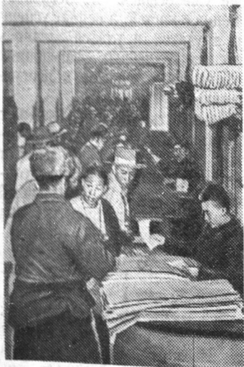
К созданию Тибетской автономной области в Китайской Народной Республике. В государственном промтоварном магазине в городе Чамдо.

ТОКИО. 11 мая (ТАСС). Как сообщило софийское радио, крупнейшая судостроительная компания «Хитаги Даосен» закончила постройку для Советского Союза рыболовного судна водоизмещением 300 тонн.