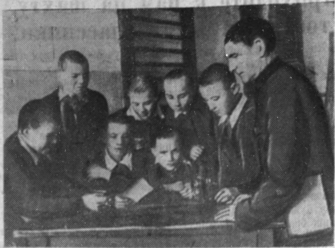
В Сланцевской семилетней школе № 5 немало учащихся, увлекающихся фотоделом. Для них здесь организован кружок, которым руководит фотолулюбитель К. С. Намочилин. На снимке: на занятии фотокружка.