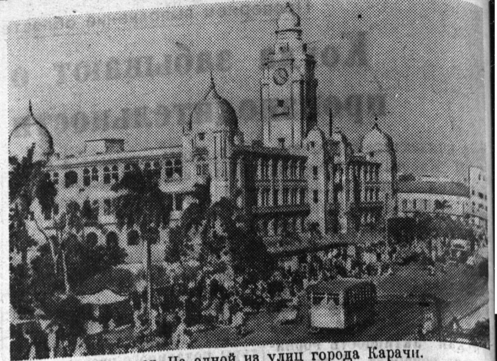
Пакистан. На одной из улиц города Карачи.