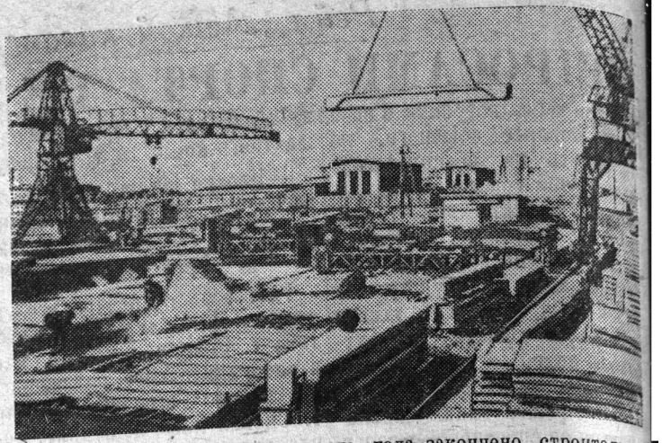
Алтайский край. В марте этого года закончено строительство второй очереди открытого треста «Стройгаз». Его производственная мощность — 15 тысяч кубометров крупноразмерных железобетонных конструкций в год. План первого квартала выполнен на 116 процентов, апрельский — на 220. Сейчас коллектив полигона выполняет заказ для строительства зерноскладов в районе целинных и залежных земель Алтая. На снимке: производство железобетонных конструкций на новом полигоне.

Красный уголок печного цеха газосланцевого завода является центром политико-воспитательной и культурно-массовой работы. Здесь читаются лекции, доклады, проводятся беседы, вечера молодых производственников, игры и другие мероприятия. Особенно многолюдно бывает в красном уголке во время обеденного перерыва: здесь можно культурно отдохнуть, почитать свежий номер газеты, интересную книгу. В красном уголке открыта библиотечка-передвижка. Для любителей настольных игр имеются шашки, шахматы, домино.