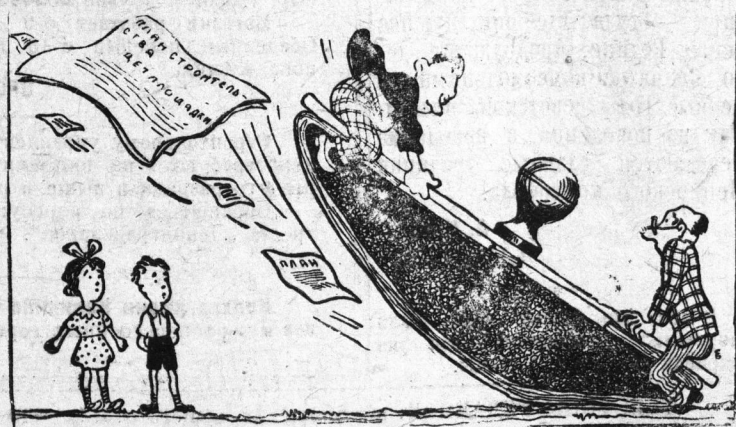
Ребята ждут, а дяди все раскачиваются...