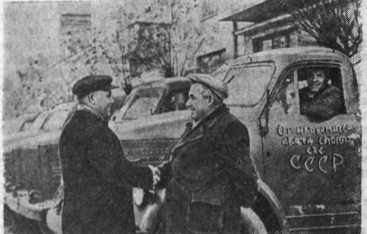
С каждым годом укрепляются торговые связи Народной Республики Болгарии с Советским Союзом. Наша страна поставляет в Болгарию оборудование и машины для промышленных предприятий, электростанций и для сельского хозяйства.

◆ Правительство Корейской Народно-Демократической Республики опубликовало заявление о сокращении численности вооруженных сил Народной армии.