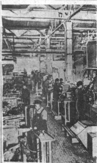
Китайская Народная Республика. К концу 1955 года, то есть за три года первой пятилетки, в стране построен и сдан в эксплуатацию 271 крупный промышленный объект. В текущем году в КНР начнется или будет продолжено строительство более 500 крупных промышленных предприятий, в том числе первого в Китае автомобильного завода. Строительство завода должно быть полностью завершено в 1956 году. Ряд цехов уже приступил к выпуску продукции. На снимке: в цехе шасси.

Сланцевскому райпромкомбинату требуются на постоянную работу: прораб на строительству, мастер по пошиву верхней одежды, закройщик по верхней одежде и платью, рабочие для работы в лесу (на временную работу). Обращаться по адресу: г. Сланцы, 1-я Советская, дом № 71. Дирекция.