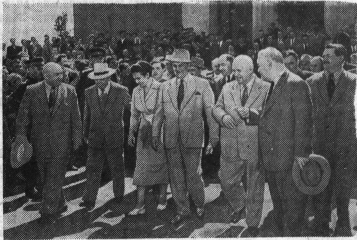
Пребывание в Москве Президента Федеративной Народной Республики Югославии товарища Иосипа Броз Тито. Руководители КПСС и Советского правительства, товарищ Тито с супругой и сопровождающими Президента лицами посетили Всесоюзную сельскохозяйственную выставку и Всесоюзную промышленную выставку. На снимке: у Главного павильона ВСХВ.