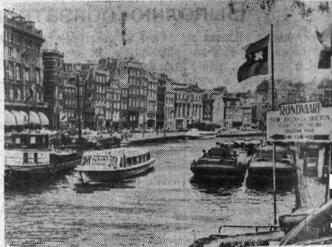
Голландия. Амстердам. На одном из каналов. Фото Л. Великжанина. Фотохроника

Пришел к станку он еле-еле. Синий под глазом, нос распух. Кроваподтеки, грязь на теле... А изо рта... сивушный дух. — Скажите, что стряслось с рабочим? — Температура высока! Она, признаться, между прочим, Уже дошла до Сорока! Взгляните на термометр новый.