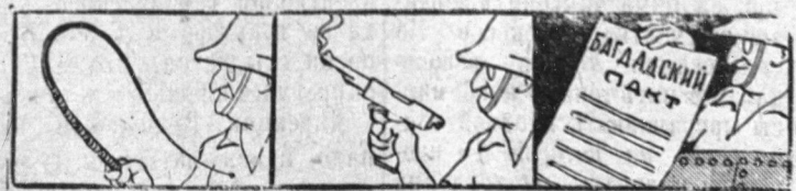
Рис. Е. Гурова.