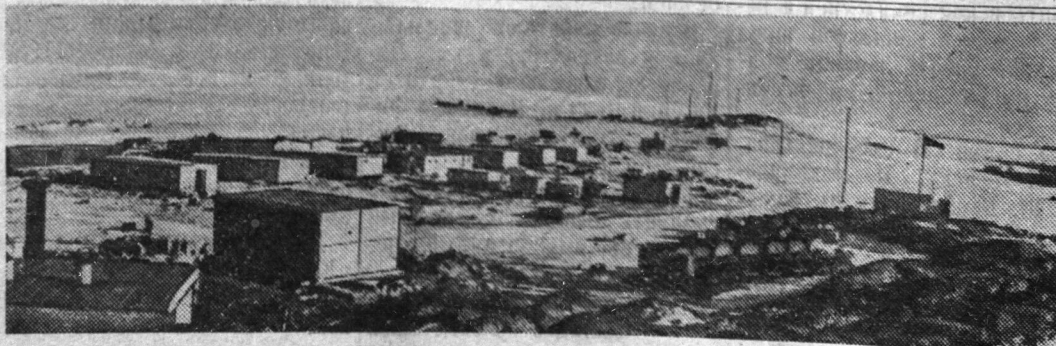
Первая Советская комплексная антарктическая экспедиция. Поселок Мирный.