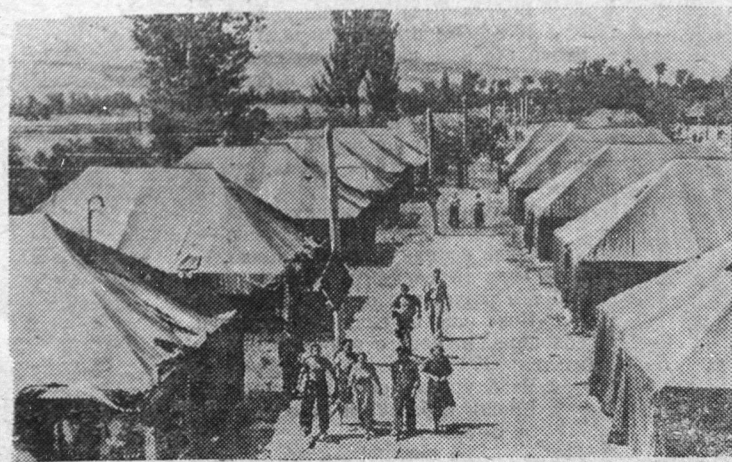
На снимке: временный палаточный городок для молодых строителей. Скоро здесь будут сооружены благоустроенные дома.

Большой Ангрэн — комсомольская новостройка шестой пятилетки. В ответ на призыв ЦК КПСС и Совета Министров Союза ССР ко всем комсомольцам и молодежи тысячи юношей и девушек Узбекистана изъявили желание принять участие в строительстве новых промышленных предприятий. Свыше шестисот молодых патриотов уже выехало на строительство Большого Ангрена.