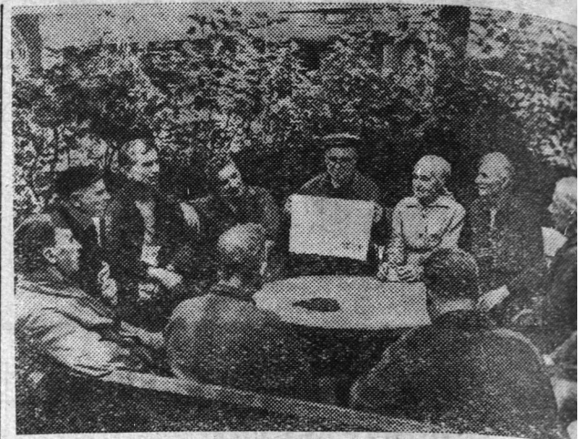
Закон о государственных пенсиях, принятый Верховным СССР, встретил всенародное одобрение.

Подготовка к экзаменам в центре внимания комсомольской организации. Этот вопрос обсужден на заседании комитета. Сейчас в школе идет подготовка к комсомольскому собранию, которое будет посвящено тому, как лучше завершить учебный год. Комсомольцы помогут администрации школы выявить и устранить имеющиеся недостатки в производственном обучении.