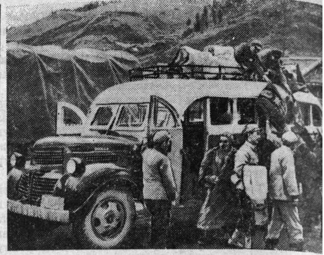
Китайская Народная Республика. Молодой город Шуа административный центр Тибетского автономного округа Авиини Сычу-ань.

На снимке: на автобусной станции в Шуацзинсы, распо. на трассе шоссе Чэнду-Аба.