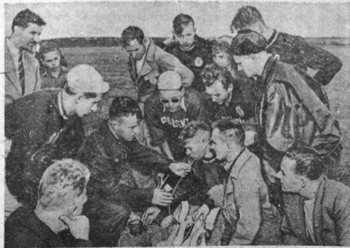
Москва. Соревнования на первенство «мира» по парашютному спорту.

уборки хлебов в Казахстан. Только за последние пять дней отгружено свыше 5 тысяч комбайнов, две тысячи находятся в процессе погрузки.