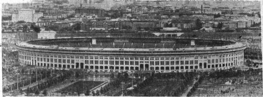
Москва. Центральный стадион в Лужниках. Большая спортивная арена.