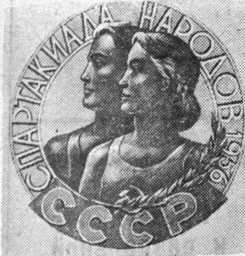
Эмблема Спартакиады народов СССР 1956 года.