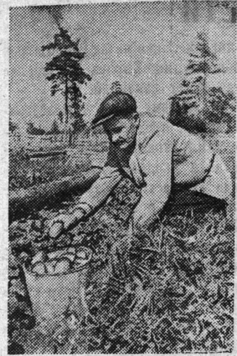
Сельхозартель имени Ворошилова, Лесогорского района, в прошлом году получила от продажи ранних овощей свыше 40 тысяч рублей.

На снимке: на опытном участке пионеры окуливают кукурузу.