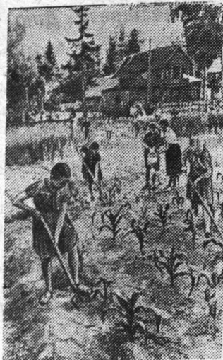
В пионерском лагере на станции Сиверская ленинградской фабрики «Канат» ребята на опытном участке площадью 35 соток выращивают лен, овощи, зерновые, кукурузу и другие культуры.

На снимке: на опытном участке пионеры окуливают кукурузу.