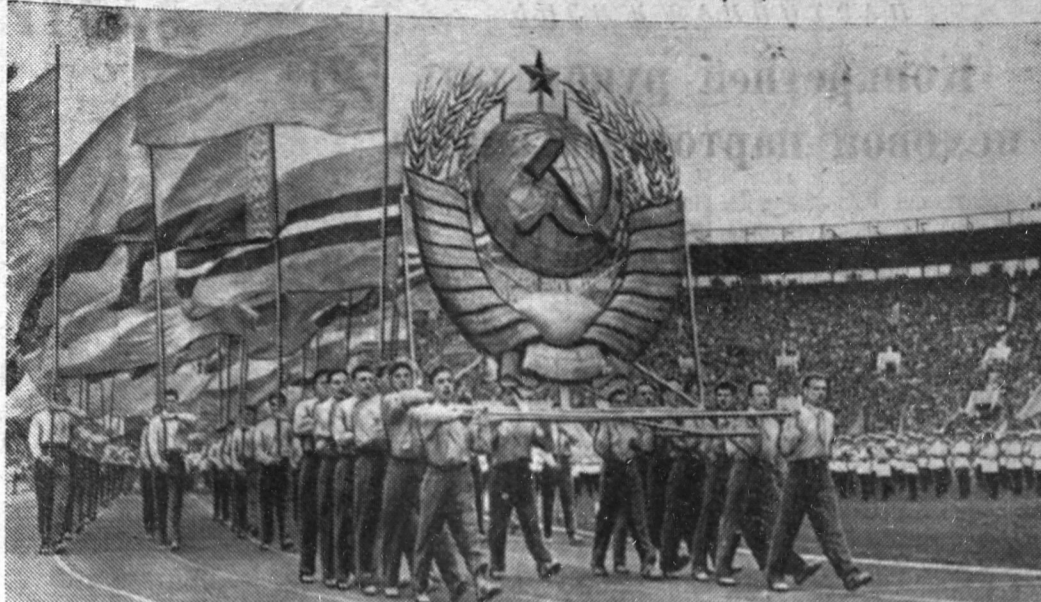
Москва. 5 августа на Центральном стадионе имени В. И. Ленина открылась Спартакиада народов СССР.