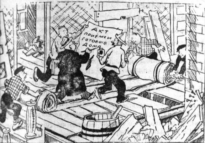
Приемочная комиссия идет...