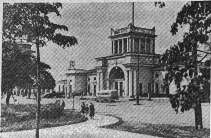
Луга. Вид на центральную часть вокзала.

Великий русский поэт А. С. Пушкин писал о Луге, в которой он бывал проездом: