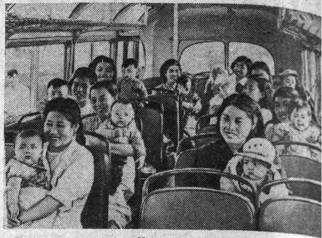
Большое внимание в Китайской Народной Республике у ся охране материнства и младенчества. В стране растет сеть детских садов. Работницы Чанчуньского автозавода после чего дня заезжают на специально предоставляемых им для предприятия автобусах за своими малышами в детские сады. На снимке: домой...!