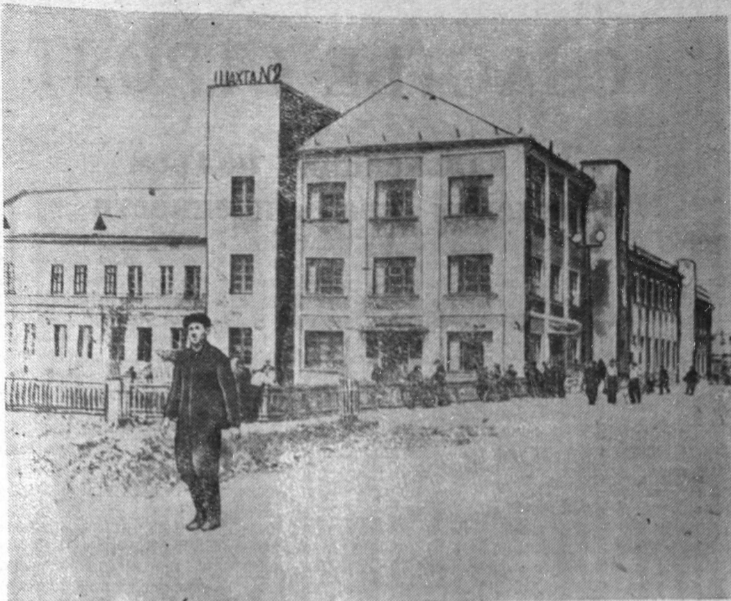
На снимке: общий вид производственного комбината шахты № 2 треста «Ленинградсланец».

июль первое место, вновь присуждены переходящее Красное знамя Министерства угольной промышленности СССР и ЦК профсоюза угольщиков и денежная премия.