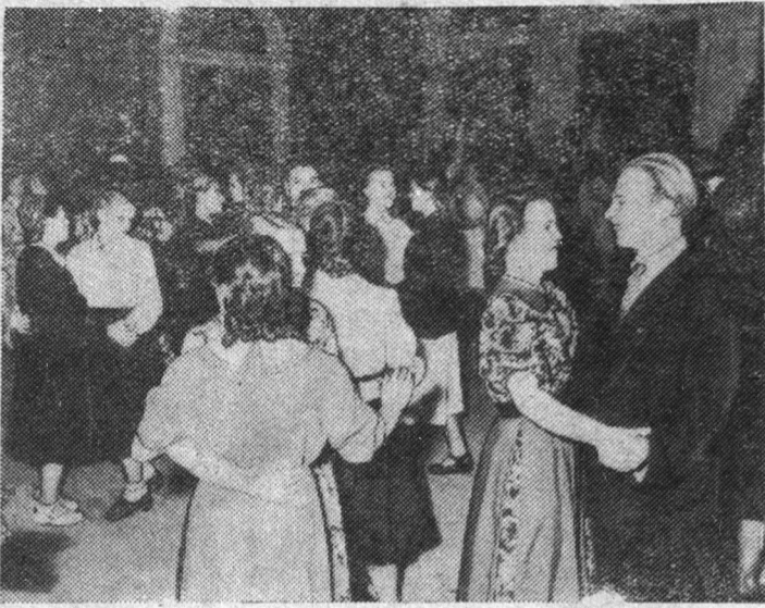
На снимке: вечер отдыха в клубе горняков.