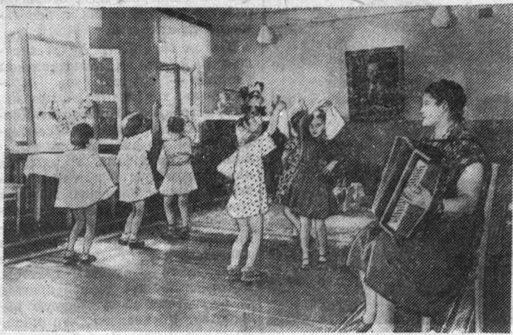
Более 100 детей горняков второй шахты посещают детский сад № 3 в поселке Большие Лучки. Весело и увлекательно проводят здесь свой досуг малыши. На снимке: в час музыкальных занятий.