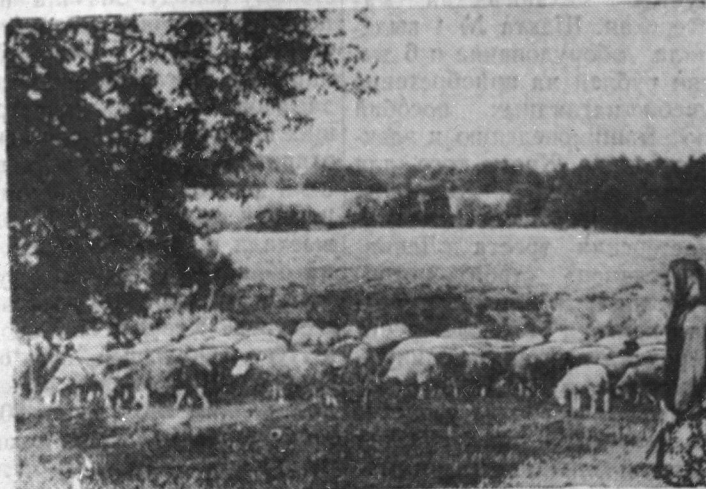
Овцевод колхоза «Обновленная земля» Пелагея Андреевна Гребенкина ныне полностью сохранила весь полученный приплод и за первое полугодие в среднем от каждой овцы настригла по 2,5 килограмма шерсти. Это дало возможность колхозу не только рассчитывать с государством по обязательным поставкам шерсти, но и значительное количество ее сдать в госзакуп.

поставок молока и значи- тельно перевыполнили план государственных закупок. Более чем в два раза пе- ревыполнила план продажи молока государству сельхоз- артель имени Ильича. На 180 процентов реализован план госзакупок молока кол- хозом «Шахтер». Сдача молока в госзакуп продолжается.