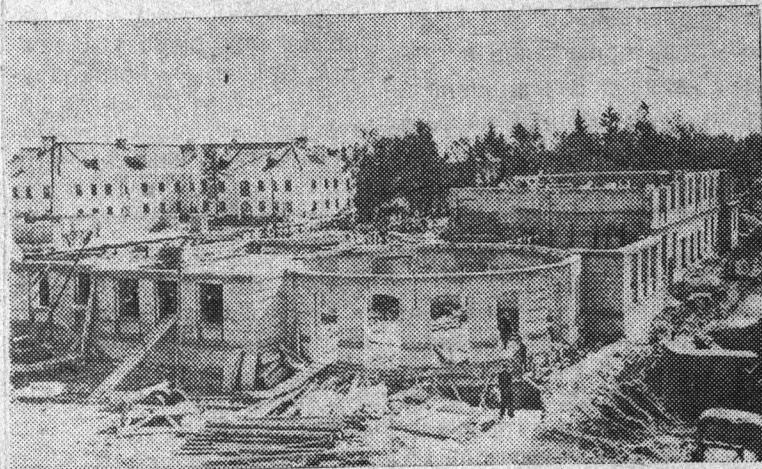
НА СНИМКЕ: строительство новых домов по улице Маяковского в поселке Большие Лучки.