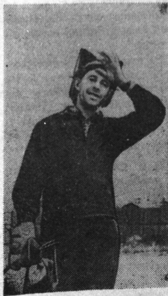
вод к нам приходи. Слесарь из тебя получится неплохой.

Юноша с нетерпением ждал того дня, когда ему придется работать непосредственно в цехе.