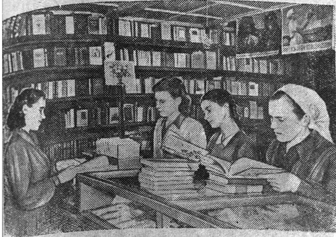
С каждым годом увеличивается спрос на книги и другую литературу в селах Ленинградской области. Магазины Ленкниготорга в поселке Шугозеро, Капшинского района, за шесть месяцев продал литературы более чем на 60 тысяч рублей. На снимке: в книжном магазине поселка «Шугозеро».