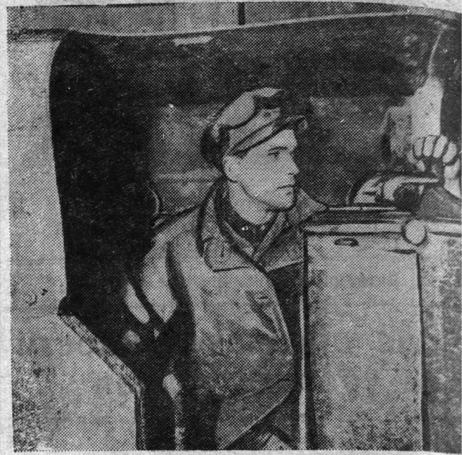
На снимке: лучший машинист электровоза шахты № Веткин. Он водит поезд без кондуктора.

Отдел пропаганды райкома КПСС, первичные партийные организации, комсомольские организации должны добиться такого положения, чтобы наступающий учебный год был проведен организованно, в полном соответствии с требованиями XX съезда КПСС и постановлениями Центрального Комитета Коммунистической партии Советского Союза.