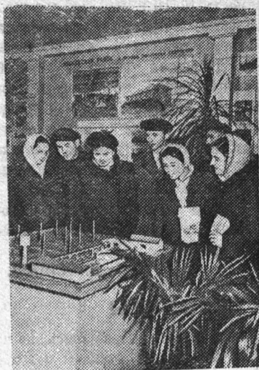
На снимке: в павильоне шефской помощи у макета теплично-парникового комбината, построенного в колхозе имени Ленина, Гатчинского района, коллективом завода «Электросила» имени С. М. Кирова.

Недавно закрылась Ленинградская областная сельскохозяйственная выставка. Ее павильоны посетили более 350 тысяч человек.