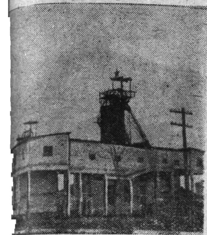
Основные сооружения шахты