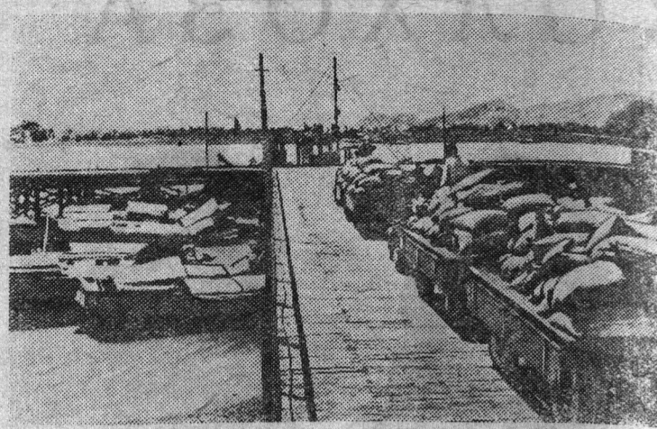
Демократическая Республика Вьетнам. В провинции Ха Тинх (центральный Вьетнам) закончено строительство крупной механизированной пристани Бан Тхон.

На снимке: на новой пристани.