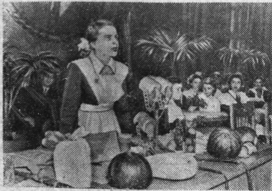
Москва. В Кремле, в клубе имени Свердлова, состоялся слёт юных кукурузоводов, животноводов и механизаторов Москвы и Московской области.

В целях укрепления кормовой базы колхозники решили заготовить 600 тонн грубых кормов, заложить на каждую корову не менее 10 тонн силоса. В целях повышения урожайности овощей намечено изготовить 200 тысяч торфоперегнойных горшочков. Колхозники предусмотрели постройку телятника, кормокухни, овощехранилища, несколько жилых домов, механизировать трудоемкие процессы в свиноводстве. Развернув социалистическое соревнование в честь XX съезда КПСС, члены сельхозартеля «Май» организованно ведут сейчас подготовку к весне. Здесь вывезено на поля около 500 тонн навоза, изготовлено свыше 50 тысяч торфоперегнойных горшочков, по-хозяйски готовятся семена.