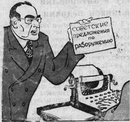
— Немедленно переврите это на английский Рис. К. Елисеева.

Из сообщения ясно, что японские расходы на содержание американских войск в Японии достигли уже доли в 10 процентов от общих расходов на содержание американских войск в Японии. Это означает, что Япония уже вносит свою лепть в общее дело.