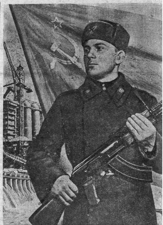
СЛАВА СОВЕТСКОЙ АРМИИ — ВЕРНОМУ С БЕЗОПАСНОСТИ СОЦИАЛИСТИЧЕСКОЙ РОД

В послевоенный период советские люди добились новых успехов в мирном хозяйственном и культурном строительстве. Вдохновляемые и руководимые Коммунистической партией, они успешно выполнили пятую пятилетку и ныне приступили к решению грандиозных задач шестого пяти-