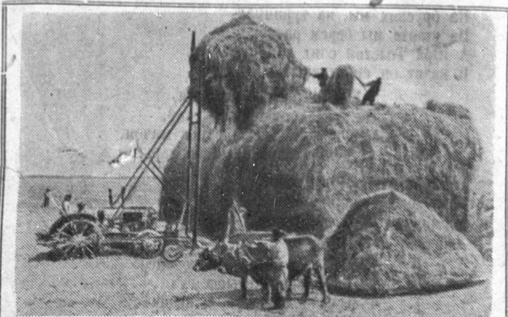
Фрунзенская область. В колхозах Киргизии начался массовый сенокос. Сельхозартели имени Молотова, Кагановичского района, с поливной площадью в 670 гектаров ежегодно снимают по четыре укоса люцерны. Сейчас здесь проходит первая косовица.

Отдел пропаганды и агитации райкома КПСС.