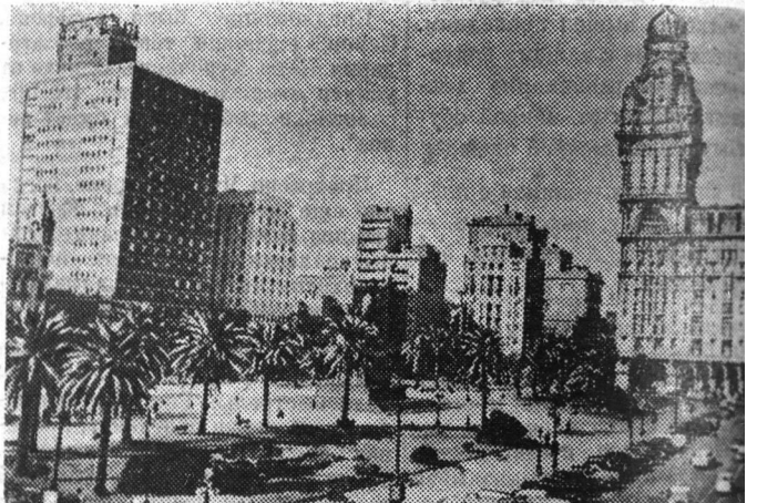
Уругвай. Площадь Независимости в Монтевидео.