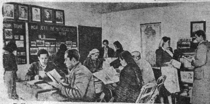
В Народной Республике Албании большое внимание уделяется повышению культурного уровня участников сельскохозяйственных кооперативов. При многих кооперативах открыты читальни.

На снимке: вид большого плеса.