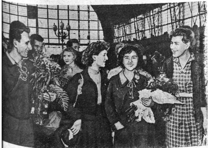
В Москву прибыла большая группа молодежи из Болгарской Народной Республики, едущая на уборку урожая на целинные земли Казахстана. На Киевском вокзале болгарских друзей тепло встречали представители молодежи столицы. На снимке: болгарские гости на площади Киевского вокзала.