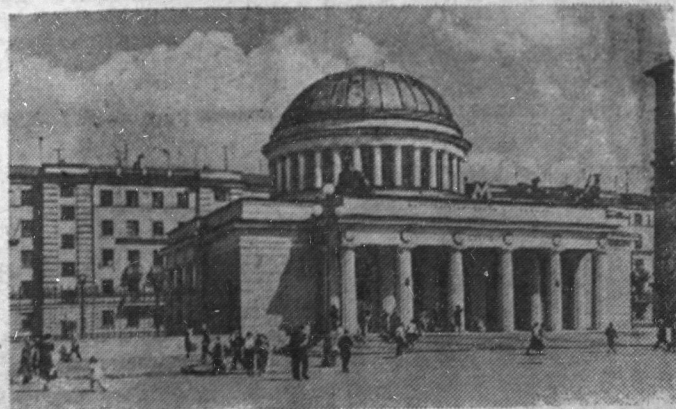
Названный павильон станции «Автово» метрополитена имени В. И. Ленина.

На сооружение производственных, культурно-бытовых и жилищных помещений в этом году в колхозах области будет израсходовано 150 миллионов рублей.