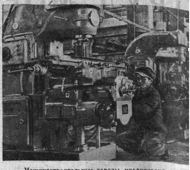
Машиностроительные заводы увеличивают производств станков и механизмов, расширяют ассортимент выпускаемых машин.

На снимке: новый танкер на верфи в Дайресе.