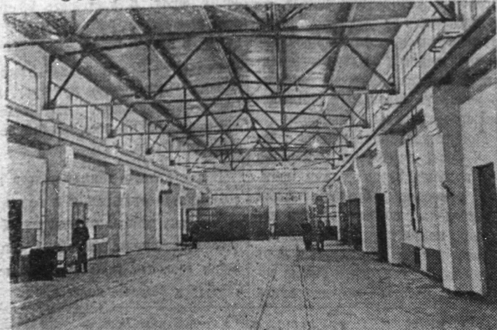
Рудинская МТС. Внутренний вид машинно-тракторной мастерской.