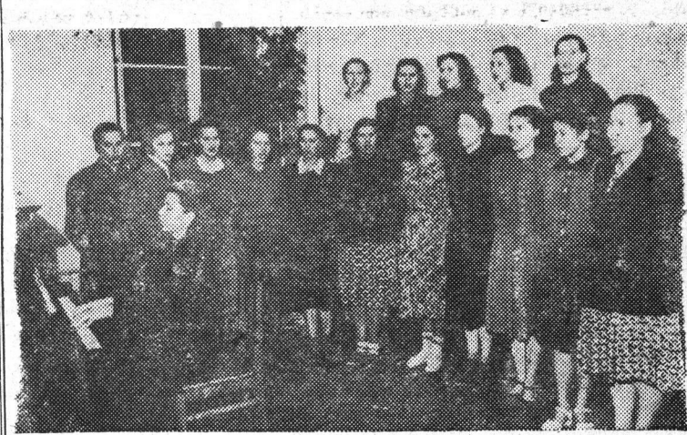
На снимке: занятие хорового кружка.

СЕЙЧАС, когда XX съезд КПСС намечил величественную программу дальнейшего повышения материального благосостояния и культурного уровня советского народа, вопросы работы профсоюзных клубов, идейно-политического воспитания трудящихся приобретают особое значение. И не случайно правление нашего клуба стремится к тому, чтобы неустанно разъяснять трудящимся решения Коммунистической партии и Советского правительства, поднимать их на осуществление стоящих задач.