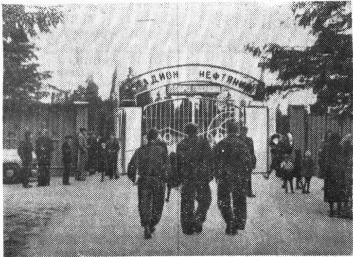
Сланцы сегодня. Молодежь идет на стадион добровольного спортивного общества «Нефтяник».