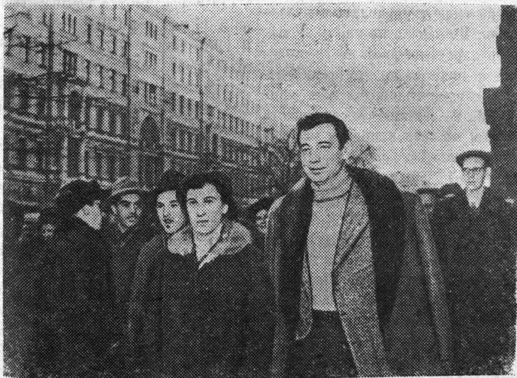
На снимке: Ив Монтан (справа) на улице Горького.