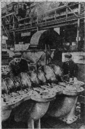
Невский машиностроительный завод имени Ленина.

В дни празднования юбилея неские машиностроители с гордостью говорят о славных революционных традициях своего коллектива. Семяниковцы, как их на-